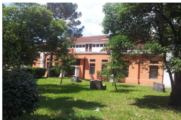
Kulturni centar, Danilovgrad

Opština Danilovgrad je odabrana od opštine Ferrara (Italija), vodećeg partnera na ovom projektu, da u Crnoj Gori sprovede pilot akciju LEGEND projekta. Naime, budžet od približno 200,000 EUR je dostupan za rekonstrukciju kulturnog centra u Danilovgradu kako bi putem geotermalnih toplotnih pumpi, koje koriste stalnu temperaturu zemlje za grejanje i hlađenje prostora, obezbjedili energetska sigurnost.